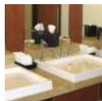
Servicios y lavabos